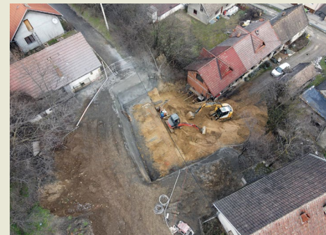
Maroje Sušac Zagreb, Croatia

The location of landslide is in city of Ilok in Croatia. The landslide occurred in early 2015 and the local road collapsed. Tensile cracks were visible at the entrances to the collapsed road, which indicated the further spread of the landslide, which endangered the surrounding residential buildings. The landslide is protected by self-drilling rockbolts, reinforcing mesh and shotcrete.