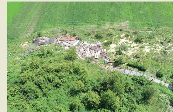
Vedran Damjanović Zagreb, Croatia

Snow melting and heavy rainfall activated catastrophic landslide in Hrvatska Kostajnica, Croatia, on 13 March 2018. Ten houses in the landslide foot were completely destroyed due to uplifting and bulging of the displaced mass. Residents of these houses were not warned in advance, but fortunately they escaped the moving landslide without fatalities.