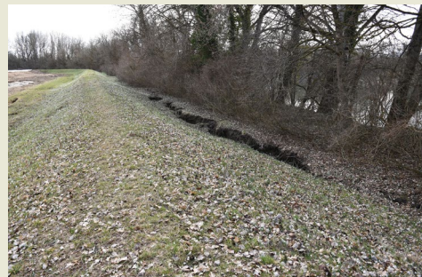
Željko Arbanas Rijeka, Croatia

The Petrinja Earthquake M_f=6.2 occurred on 29 December 2020 at 12.19 pm caused significant damage and casualties. Lateral spreading was identified on 27 locations at the riverbanks of Kupa, Sava, Gline and Maja rivers in Sisačko-Moslavačka County. The lateral spreading damaged the Kupa River protection embankment near the Stara Drenčina settlement in length of 600 m causing total displacement of the riverbank of about one meter in Kupa River.