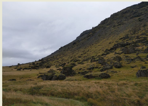
Željko Arbanas Rijeka, Croatia

— The rockfall blocks of volcanic breccia in the toe of the Ingólfssjall Tuya (a flat-topped, steep-sided volcano formed when lava erupts through a thick glacier or ice sheet) north of the Selfoss settlement, Iceland. The Ingólfssjall Tuya is 551 m high and mostly built of volcanic breccia. The first vegetation on lava covered Iceland is moss that also begins to grow on volcanic breccia blocks.