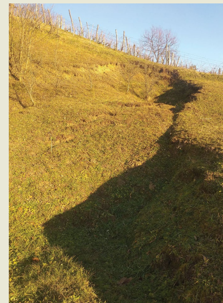
Marko Sintić Zagreb, Croatia

— In Hrvatsko zagorje, in the Meljan Village, Croatia, a landslide occurred as a result of a heavy rainfall event. The landslide toe was heavily affecting the road, barely avoiding houses and yards. Slowly pushing the nearby fence and being in close proximity to buildings, this 25x60 m landslide is waiting for remediation.