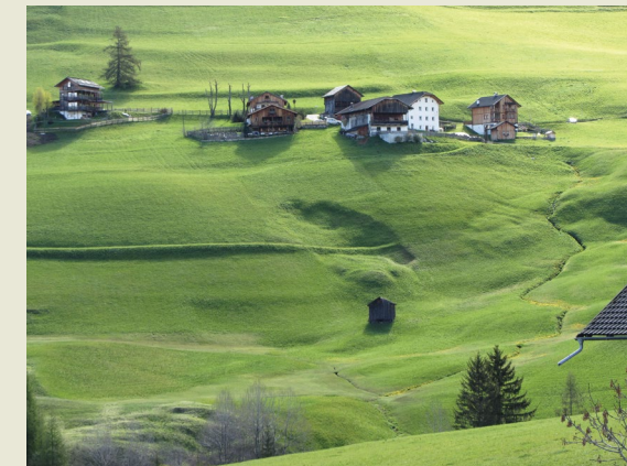
Martin Krkač Zagreb, Croatia

— The photo was taken on 20 May 2016, from the hotel balcony in Alta Badia (Italy), one day after the student excursion on the Vajont dam landslide. The length of the landslide, measured from Google Earth satellite images is approximately 50 m, and the width is approximately 20 m. Although the activity of the landslide is probably dormant, the morphology is very well preserved due to grassland maintenance.