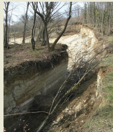
Sanja Bernat Gazibara Zagreb, Croatia

— The landslide is located in the Podsljeme zone in the City of Zagreb (Croatia). It was activated on 13 February 2014 after a prolonged heavy rainfall period. The block of marl rock was translated about 60 meters, which opened a smooth sliding surface measuring approximately 60x70 m. The total landslide area is approx. 12,000 m 2 .