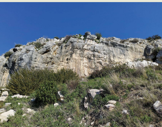
Hrvoje Lukacić Zagreb, Croatia