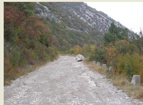
Petra Jagodnik Rijeka, Croatia

— Rockfalls are among the most common landslide types in the Vinodol Valley. Different types of talus deposits have been accumulated at the footslopes of carbonate rock slopes, and in the hypsometrically lower parts of the valley. Olistoliths and boulders can be found there irregularly distributed. The photo is taken in November 2018 at the road connecting the Vinodol Valley with its hinterland.