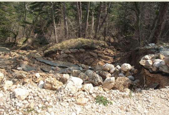
Petra Jagodnik Rijeka, Croatia

The landslide is located in Mala Dubračina gully in the Vinodol Valley. It was reactivated in February 2016. The previous landslide activity was documented in 1965. The landslide crown was formed at the local road connecting the county road and Rupe village, passing along the gully channel border. The type of landslide is debris slide. The area is approximately 2,000 m 2 .