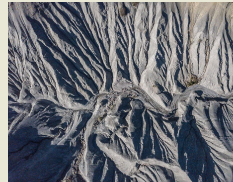
Martina Vivoda Prodan Buzet, Croatia

— Near the smallest town in the world, Hum, in the centre of the Istrian peninsula in Croatia, there is a small desert. The Mučan badland is located in the flysch complex with an area of approximately 2.5 ha. The high erodibility of the fine-grained sedimentary rock, marl, leads to the formation of badlands, which are particularly susceptible to slope movements.