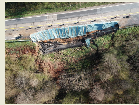
Mirko Grošić Rijeka, Croatia

Dubravci Landslide is located on state road DC3, section 012 at km 4+400. The earthquakes in Banovina on 28 and 29 December 2020 caused the activation of the sliding of already potentially unstable material of the road. Landslide is 85 m wide, 35 m long with the main scarp of approximately 3.5 m in height.