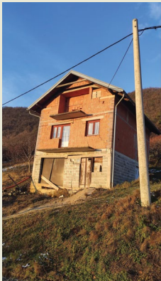
Sanja Bernat Gazibara Zagreb, Croatia