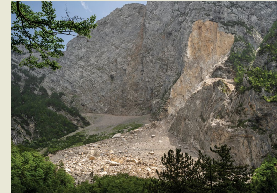
Matija Zupan Ljubljana, Slovenia

Rzenik mountain rockfall cuts off hiking trail. On 26 February 2021, after a period of heavy rain and an unusual warm temperature, a part of the northern wall of Triassic limestone collapsed. The event produced about 800,000 m 3 of material and was even detected on several seismographs. Deposit area was 13 ha with individual rock blocks of the size up to 2,000 m 3 or 20x15 m.