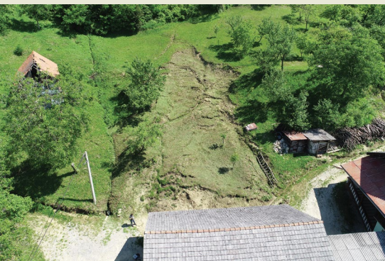
Vedran Damjanović Zagreb, Croatia

— A drone photo of this unique landslide was taken on 4 June 2019, in Bednja Municipality, Croatia. The landslide was activated by heavy rainfall and left a specific footprint on the terrain in the form of the Greek letter delta (Δ).