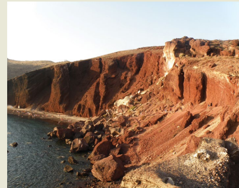
Željko Arbanas Rijeka, Croatia

The Red Beach is located at the south-eastern part of the active volcanic island Santorini, Greece, and is one of the most famous beaches within the Aegean and Mediterranean Seas due to its particular color. In August 2013, a rockfall occurred, fortunately, during the night, and the debris with older rock detachments composed of volcanic rocks are evident along the entire length of the cliff over the beach.